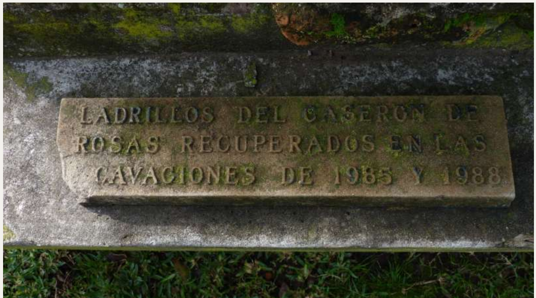
Figura 2. Ladrillos del Caserón de Juan Manuel de Rosas en la actual Plaza Sicilia, Parque 3 de Febrero, obtenidos durante la excavación arqueológica realizada en la década de 1980.