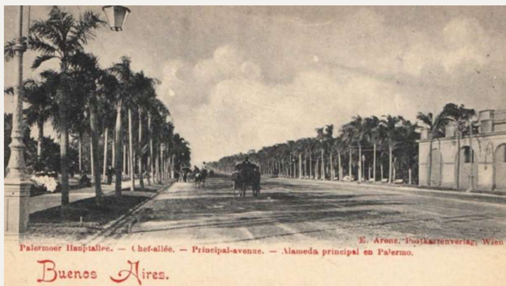
Figura 4. Galería de palmeras pindó en postal de fines del siglo XIX de la actual avenida Sarmiento, Parque 3 de Febrero. A la derecha se aprecia la casona de Juan Manuel de Rosas sin demoler aún.

Observaciones: los árboles permiten su identificación con carteles pequeños a medianos, más uno grande que presente la temática.