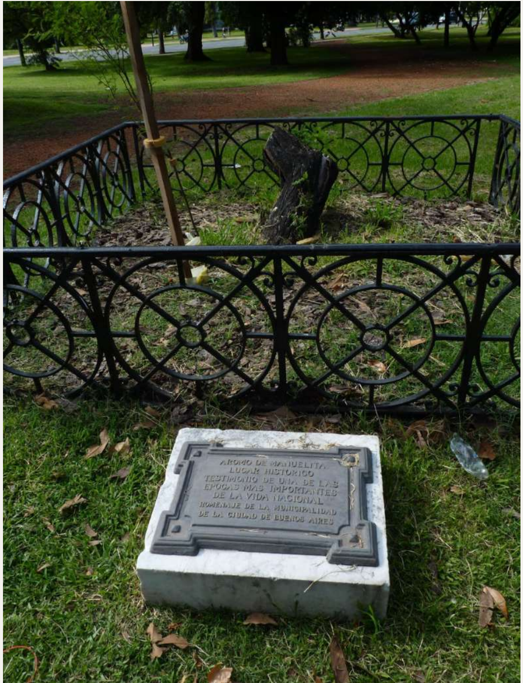
Figura 3b. Cartel del aromo del perdón en 2019 donde se aprecia el ejemplar muerto por un incendio el año anterior.

Hacia finales del siglo XIX se instaló una doble hilera de palmeras pindó sobre la actual avenida Sarmiento (ver Figura 4). Durante el siglo XX se fueron reemplazando por jacarandás y algunas palmeras pindó. La galería de palmeras fue documentada en postales de la época.