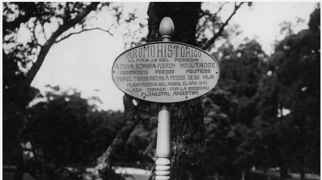
Figura 3a. Cartel del aromo del perdón en 1931, Plaza Sicilia.

El único árbol señalado en Plaza Sicilia es el “aromo del perdón”, perteneciente a una especie nativa: el aromito ( Vachellia caven ) (ver Figura 3). El ejemplar histórico fue plantado en 1845 por Manuelita Rosas, la hija de Juan Manuel de Rosas, y a su sombra ella pedía el indulto de su padre a los condenados. Hacia la década de 1970 el ejemplar murió y fue reemplazado por un aromo australiano por error (José María Menini, com. pers.). Luego se plantó uno nativo que fue incendiado en 2018 y repuesto al año siguiente.